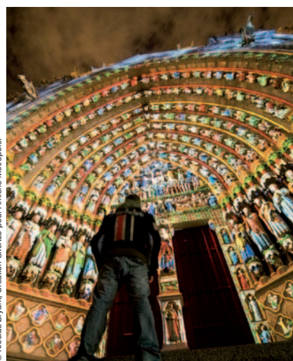
© Nicolas Bryant, Création Skertzo pour Amiens Métropole.

INFOS + Circuit de 290 km d'Amiens à Amiens.